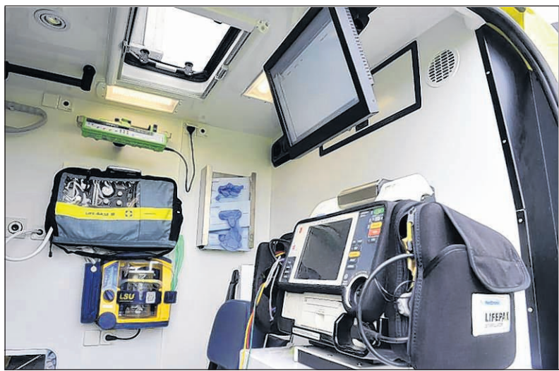
Het interieur van de Mercedes-Benz Emergency Sprinter 319 CDI.