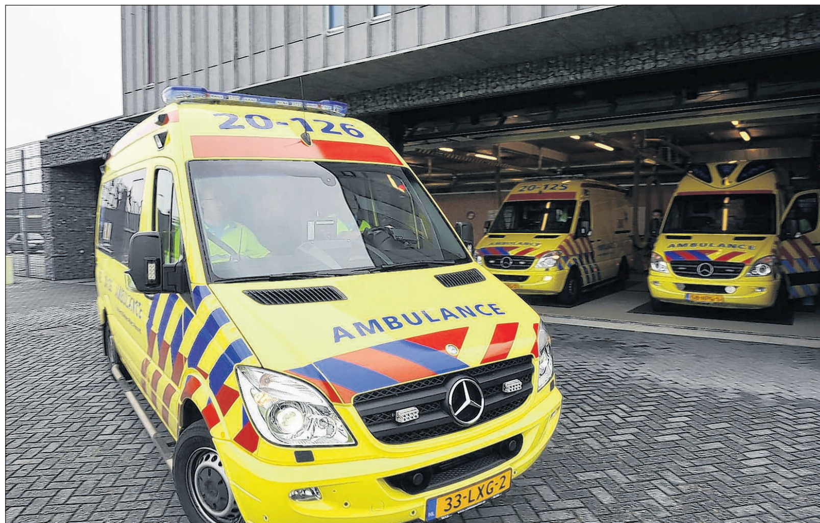
Een van de nieuwe ambulances verlaat het pand. De deur is automatisch geopend, de afzuiging afgekoppeld en de navigatie ingevoerd.